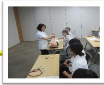
10月救急看護 ラダー1対象 BLS研修風景